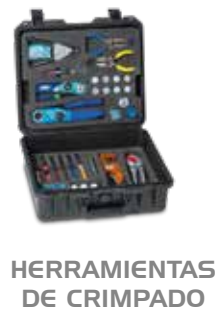
HERRAMIENTAS DE CRIMPADO