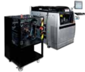
MARCACIÓN POR LASER