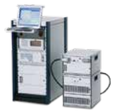
EQUIPOS DE TEST ELÉCTRICOS